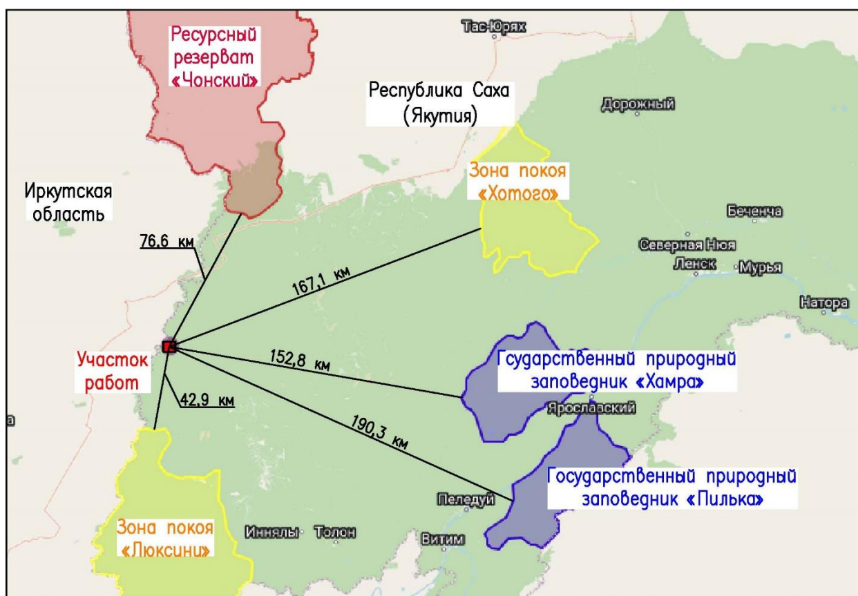
Рисунок 10.1 - Ближайшие к участку работ особо охраняемые природные территории ( https://sakhagis.ru/map/oopt )