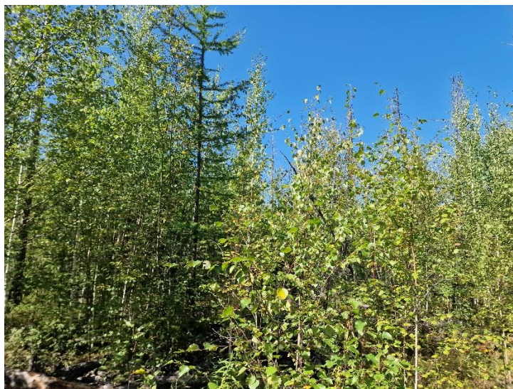
Рисунок 9.1 - Сообщества лиственнично-березовых лесов с примесью ели, сосны, кедра и ольхи ПКОЛ

Травяно-кустарничковый ярус хорошо выражен. В нем преобладает брусника, примесь образует голубика, смородина. Из травянистых видов встречается иван-чай узколистный, копеечник альпийский, пижма, подорожник средний, хвощ полевой.