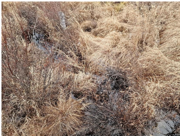
Рисунок 9.2 - Сообщества осоково-кустарничковой растительности ПКОЛ